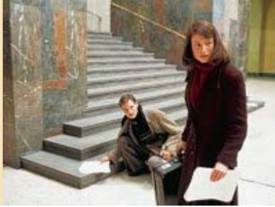
Verteilung der Flugblätter

Was tut Sophie? Was für eine Rolle spielt sie? Wie kann man die Beziehung von Sophie und Hans beschreiben?