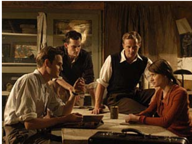
Foto dal film