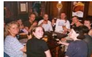
die Freunde im Pub treffen