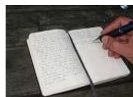
mein Tagebuch schreiben