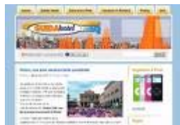
mein Blog weiterbauen