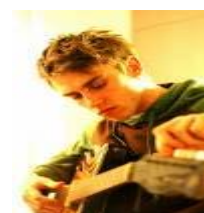
ein Instrument spielen