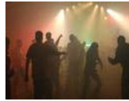
in die Disko gehen