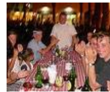
mit meinen Freunden ausgehen