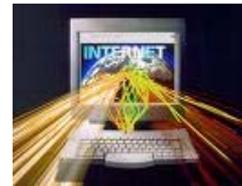
im Internet surfen