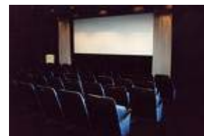
ins Kino gehen