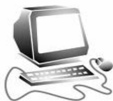
mit dem Computer spielen