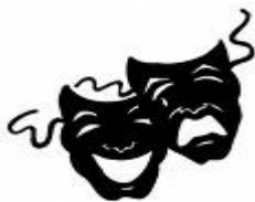
ins Theater gehen